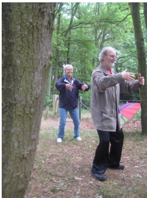
Samen onder één paraplu