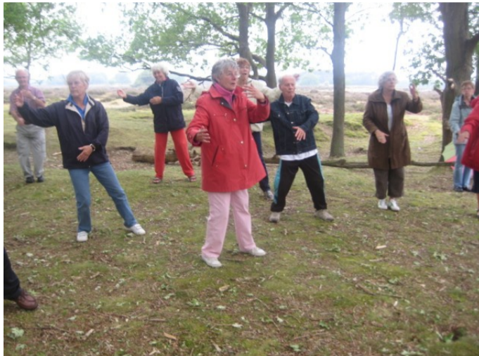
Dat was gezellig