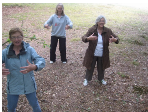
Zo kan het ook: De Boom vast houden