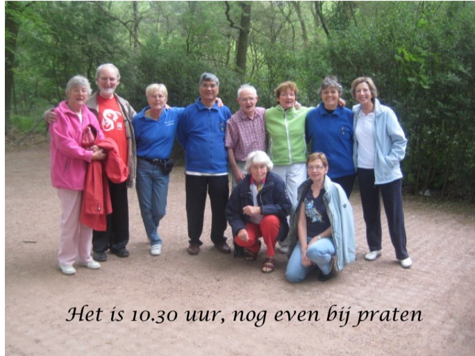
Het is 10.30 uur, nog even bij praten

De 55+ Taijiquan Sporters van Versa uit Eemnes traint door weer en wind op de Heide in Blaricum. De ochtend werd afgesloten met een overheerlijk lunch in Restaurant de Tafelberg.