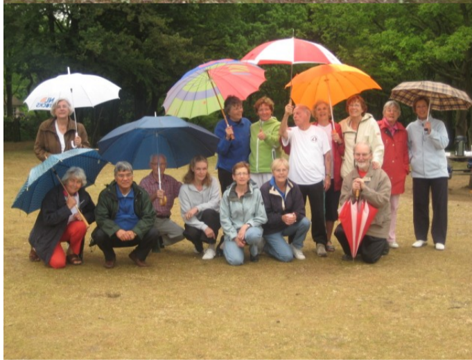
8 Yang Taijiquan